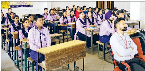
बराड़ा। कार्यक्रम के दौरान उपस्थित स्टूडेंट्स।

संत मोहन सिंह पब्लिक स्कूल में सोमवार को शिक्षा मंत्रालय भारत सरकार के तत्वाधान में "विकसित भारत" विषय पर एक ऑनलाइन सेमिनार का आयोजन किया गया। सेमिनार में देशभर के सरकारी एवं निजी विद्यालयों के शिक्षक और विद्यार्थी ऑनलाइन माध्यम से शामिल हुए। कार्यक्रम का मुख्य उद्देश्य विद्यार्थियों को "विकसित भारत" के संकल्प से जोड़ना और उनमें आत्मनिर्भरता की भावना विकसित करना था।