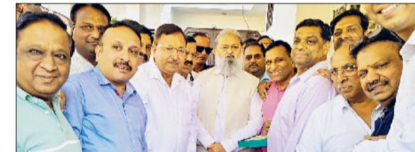
अंबाला। मंत्री अनिल विज से मुलाकात करते जैन सभा के नवनियुक्त पदाधिकारी।

मंत्री अनिल विज से सोमवार को उनके अंबाला छावनी स्थित आवास पर श्री दिगंबर जैन सभा अंबाला छावनी के नवनियुक्त पदाधिकारी पहुंचे। मंत्री ने उनका स्वागत कर उन्हें नई जिम्मेदारी संभालने पर शुभकामनाएं दीं। इस अवसर पर सभा के नवनियुक्त प्रधान राजेश जैन सहित पूरी कार्यकारिणी मौजूद रही। उर्जा मंत्री ने पदाधिकारियों से बातचीत के दौरान कहा कि जैन सभा समाज सेवा के क्षेत्र में लंबे