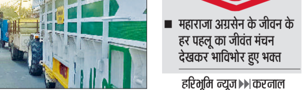
हरिभूमि न्यूज ॥ करनाल

महाराजा अग्रसेन के जीवन के हर पहलू का जीवंत मंचन देखकर भाविभोर हुए भक्त