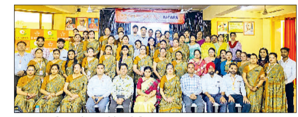
बराड़ा। कार्यशाला में भाग लेने वाले शिक्षक।