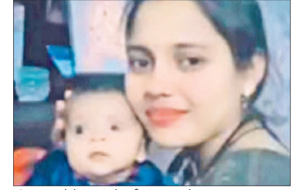
अंबाला। हादसे में जान गंवाने वाली मां व मासूम बेटा।

► एसडी कॉलेज के पास तेज रफ्तार ट्रॉले ने स्कूटी को टक्कर मार दी। ► हादसे के बाद आसपास के लोग तुरंत मौके पर पहुंचे।