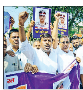
की संख्या में पहुंचे प्रदर्शनकारियों ने लघु सचिवालय पर पहुंचकर उपायुक्त (DC) को राज्यपाल के नाम ज्ञापन सौंपा। उन्होंने मांग की कि इस मामले में उच्चाधिकारियों की भूमिका की निष्पक्ष जांच कर डीजीपी व एस्पपी को बर्खास्त किया जाए तथा दोषियों को तत्काल गिरफ्तार कर कड़ी सजा दी जाए।

सरकार-प्रशासन की लापरवाही पर दलित संगठनों का फूट गुस्सा