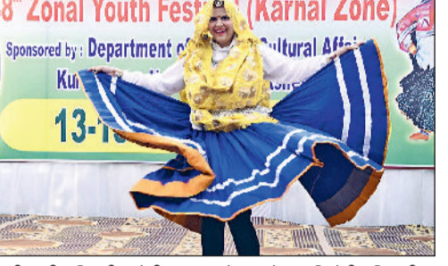
इंदी 3 तीन दिवसीय क्षेत्रीय युवा महोत्सव में प्रस्तुति देती प्रतिभागी।