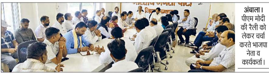
अंबाला। पीएम मोदी की रैली को लेकर चर्चा करते भाजपा नेता व कार्यकर्ता।

प्रधानमंत्री नरेंद्र मोदी की आगामी 'जन विश्वास-जन विकास' रैली को लेकर जिला में भाजपा की विशेष तैयारी बैठक आयोजित की गई। अध्यक्षता भाजपा जिलाध्यक्ष मनदीप राणा ने की जिसमें जिला पदाधिकारी व मंडल अध्यक्षों ने भाग लिया। बैठक में भाजपा प्रदेशध्यक्ष मोहन लाल बडौली के निर्देशों को सांझा करते हुए 17 अक्टूबर को रैली की तैयारियों पर